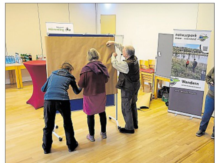
Das kreative Programm war abwechslungsreich.