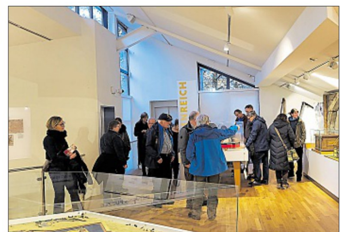
Das Museum an der Koppelschleuse gibt spannende Einblicke.