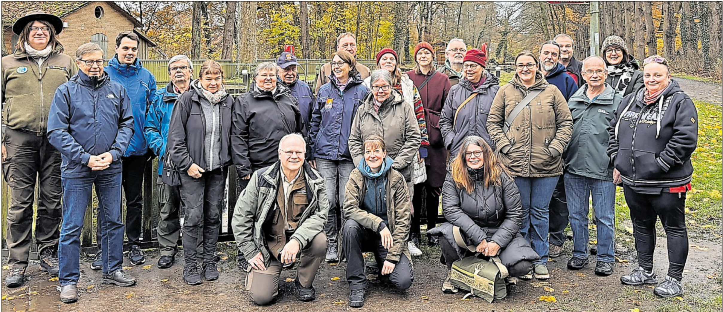
Die Naturführer aus Niedersachsen kommen regelmäßig zusammen.