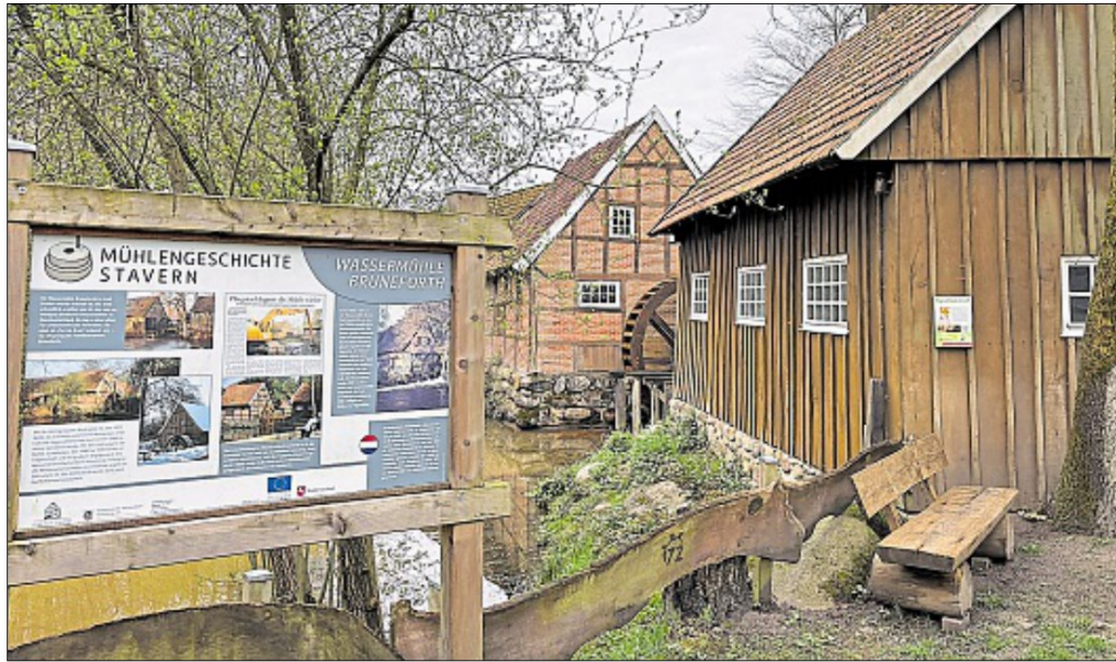
Auf einem Hümmling-Pfad erfahren Wanderer die Mühlengeschichte.

Und mit etwas Glück erleben Wanderer diese Zeremo-